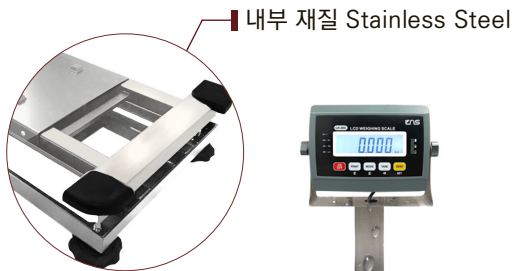
■ 내부 재질 Stainless Steel