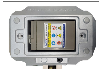
TCR Series 전용 배터리