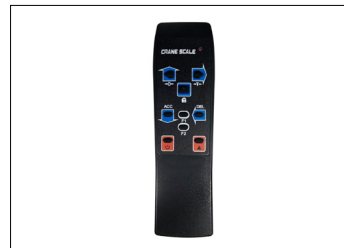
TCR Series 전용 리모콘(기본제공)