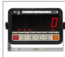
LK-330 인디케이터 밝고 선명한 LED타입 LED 6자리, 7세그먼트 (높이:38mm)