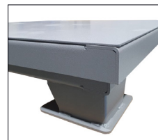
국산 자재와 고급 분체도장 사용 타사 대비 0.5mm 두꺼운 강판 사용