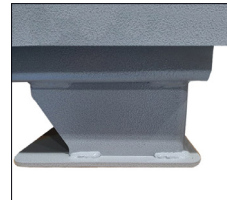
지게차의 이동이 용이한 높이