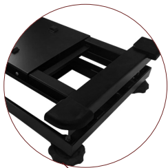
내부 재질 Steel